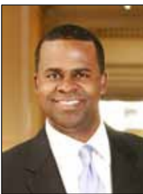
Hon. Carol W. Hunstein Chief Justice des Supreme Court von Georgia

“Willkommen in Atlanta! Durch meine Tätigkeit in einer internationalen Rechtsanwaltskanzlei habe ich festgestellt, dass internationale Schiedsgerichtsbarkeit einer der Grundpfeiler des internationalen Geschäfts ist. Parteien, die Atlanta als Schiedsgerichtsort wählen, werden hervorragende Praktiker und ein Gerichtswesen vorfinden, das Schiedsgerichtsverfahren unterstützt. Sie werden auch eine lebendige und vielfältige Stadt vorfinden, die reichhaltig Unterhaltung und eine Vielzahl von Restaurants bietet und deren Infrastruktur für Dienstreisen unschlagbar ist.“